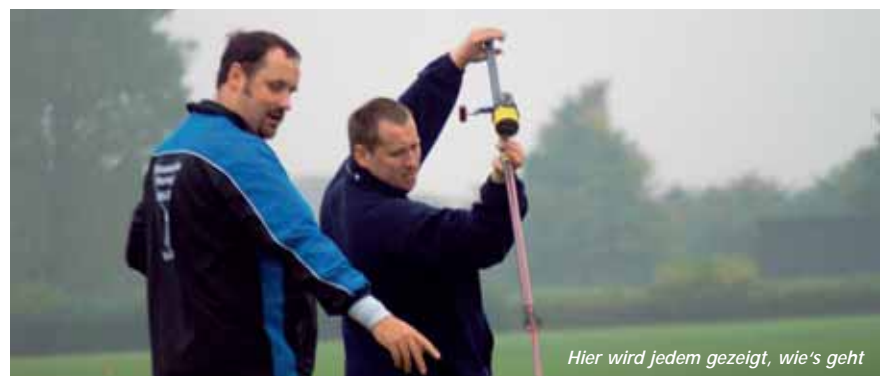
Hier wird jedem gezeigt, wie's geht